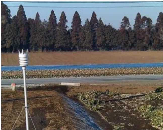
写真3 やちぼこり前