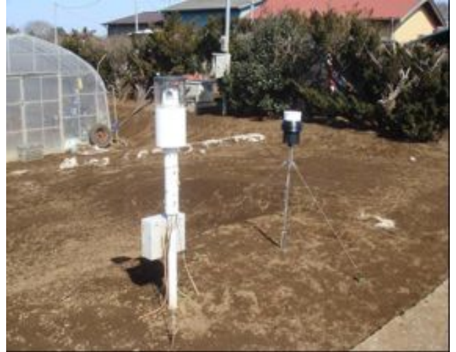
写真2 やちぼこりモニタリングシステム