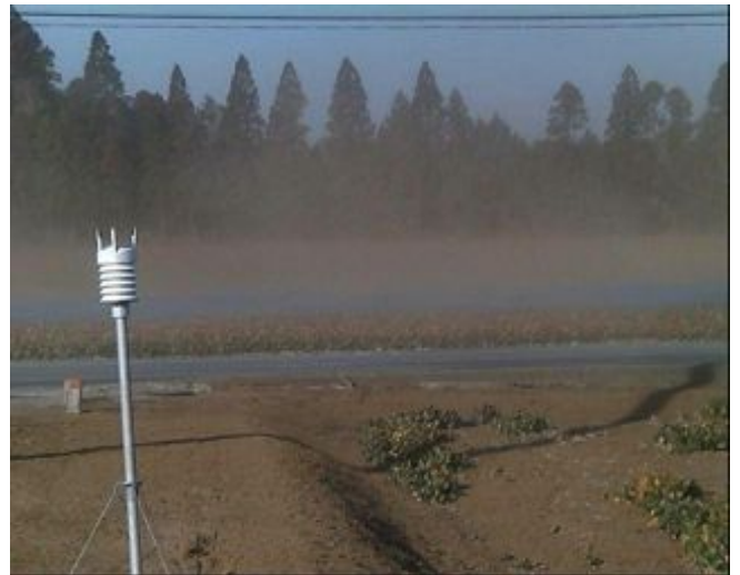
写真4 やちぼこり後