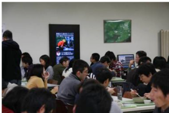
写真5 食堂での風景