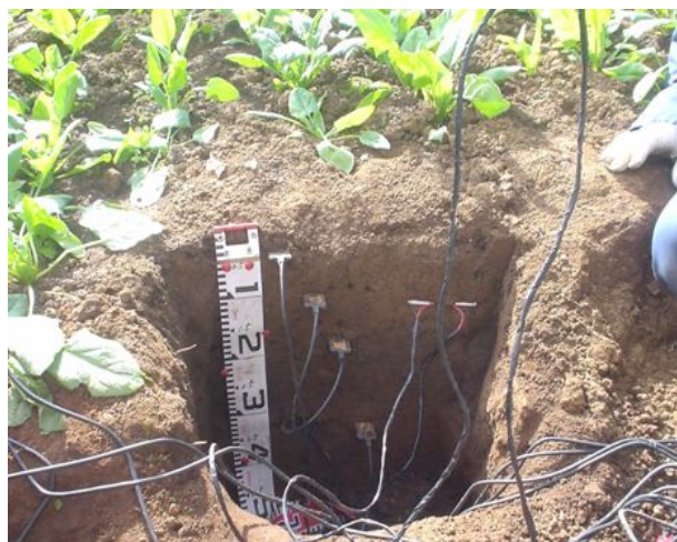
写真2 土壌水分センサーの埋設