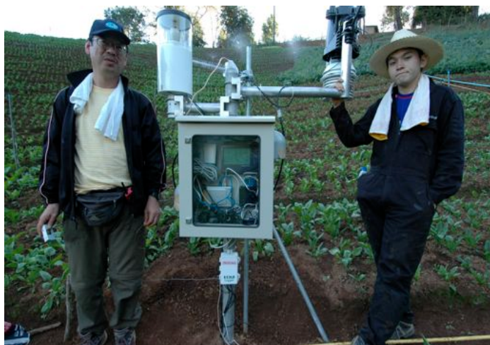
写真3 ほうれん草畑モニタリングシステム