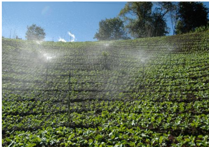
写真1 チェンマイのほうれん草畑

目的：東京大学生協食堂で提供している「ほうれん草」はタイで生産されている。食堂を利用している学生にタイの生産現場を知ってもらい、安全な農産物に関する意識の向上を図る。