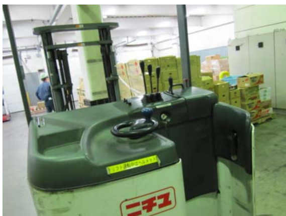
図3. 運搬用フォークリフト

作業施設全般を見学させていただいた結果、温湿度管理・衛生管理また、作業員のトレーニングも充実しているように感じられた。特に、商品ごとに保存に最適な温度がコンピューター管理によって選別され適切な冷蔵庫に貯蔵保管されるシステムや、取引先小売店のニーズにあわせた緻密なラベリングや包装資材の管理には、高度に組織化された青果物流通の現場をかいま見る事ができた。