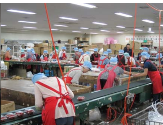
図6. 包装・箱詰め・検品作業