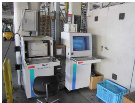
図2. 荷受け票管理 (ラベル)