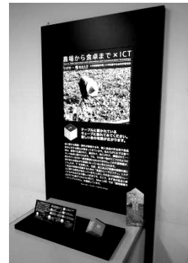
Fig. 2 Media Top とモニター